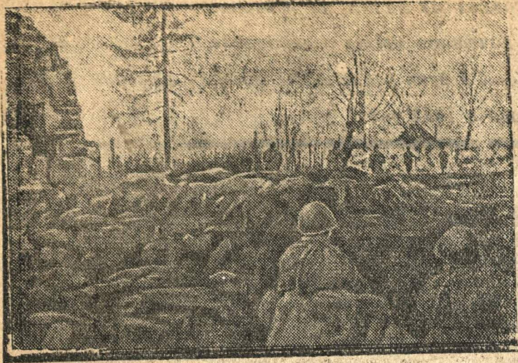
Действующая Армия. (Западный фронт).