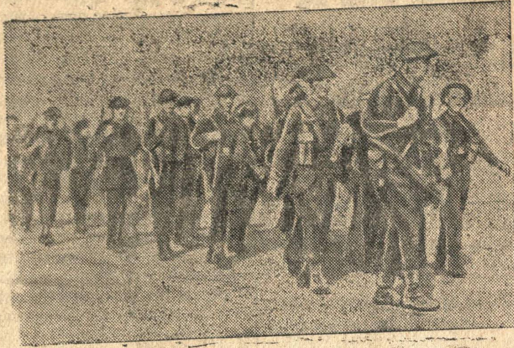
На снимке: Солдаты английского военно-воздушного полка продвигаются в Мэзон-бланш (Алжир) для занятия аэродрома.