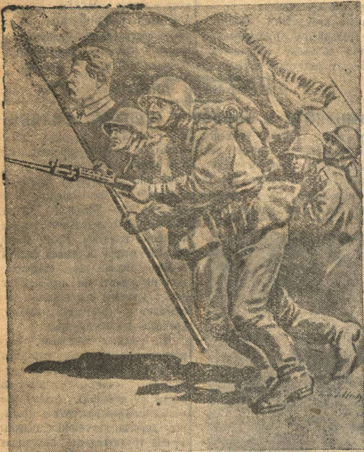
Вперед, за разгром немецких оккупантов! Рисунок лауреата Сталинской премии художника П. Соколов-Скала

ТОВАРИЩИ КОЛХОЗНИКИ И КОЛХОЗНИЦЫ! ОТДАДИ М ВСЕ СИЛЫ, ВСЕ СВОИ СПОСОБНОСТИ, ВСЮ ЭНЕРГИЮ И ВОЛЮ ДЛЯ ТОГО, ЧТОБЫ ПОМОЧЬ КРАСНЫМ ВОИНАМ В НОВЫХ РЕШАЮЩИХ БОЯХ ОТБРОСИТЬ, РАЗБИТЬ И УНИЧ- ТОЖИТЬ НЕНАВИСТНОГО ВРАГА!