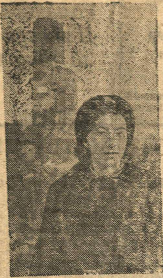
Отважная комсомолка — патриотка

Курс секретарей комсомольских организаций