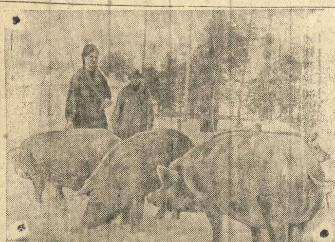
Животноводческие фермы Наркомзема СССР при Всесоюзной сельскохозяйственной выставке снабжают молочными продуктами население Москвы и госпитали, выращивают молодняк для колхозов районов, освобожденных от немецко-фашистских захватчиков.

Выращивание крольчат до 6-месячного возраста на одну кроликоматку, наличную на начало года . . . . . 11 голов. Сбор шкура на каждую наличную на начало года кроликоматку ангорской породы с приплодом . . . . . 400 грамм. Размер сдачи кроличьих шкурок первого сорта в процентах от общего количества сданных шкурок . . . . . 40 проц.