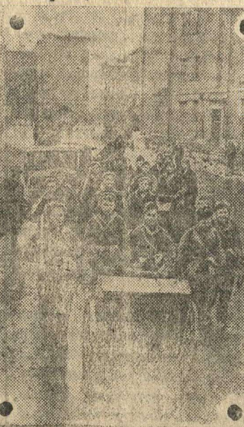
Бойцы дегазационной роты МПВО Пролетарского района Москвы идут на практические занятия.