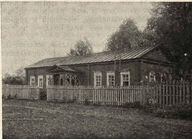
Амбулатория в селе Болдино.