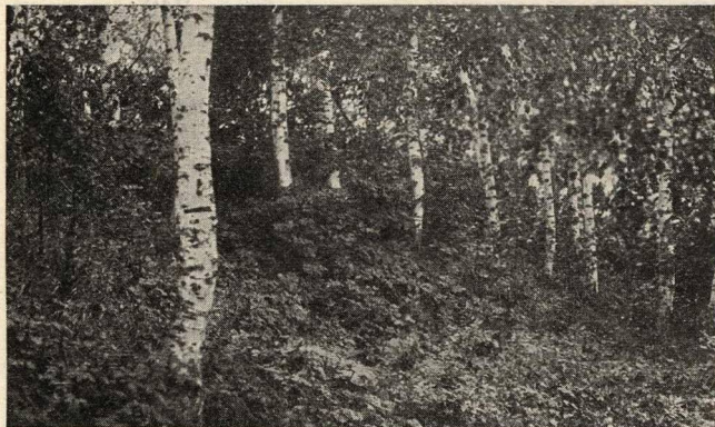
Уголок Болдинского парка