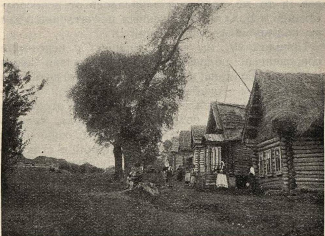
Один из порядков села Болдино