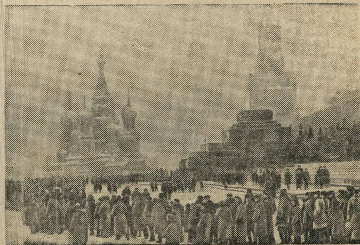
Трудящиеся у мавзолея Ленина.