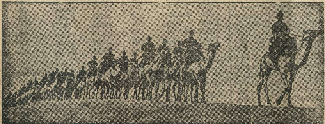
Тренировочные учения египетских войск в условиях пустыни.