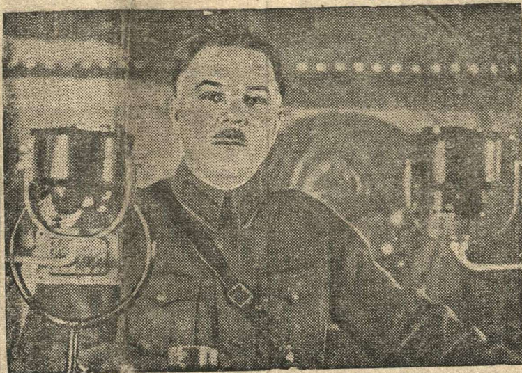
Б. Е. Ворошилов на трибуне XVII съезда ВКП(б). (Январь 1934 г.)

В текущем году необходимо поставить учет в колхозах так, чтобы ни одна колхозная копейка, ни один трудодень колхозника не пропадали. Пора, наконец, поставить дело так, чтобы каждый колхозный счетовод соответствовал своему назначению, способствовал бы правильной постановке учета, получению высоких урожаев, еще больших доходов от общественного хозяйства.