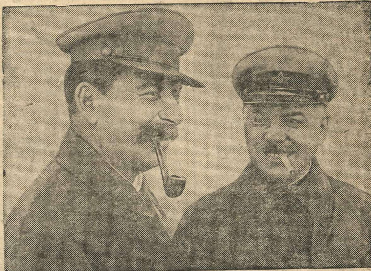
И. В. Сталин и К. Е. Ворошилов.