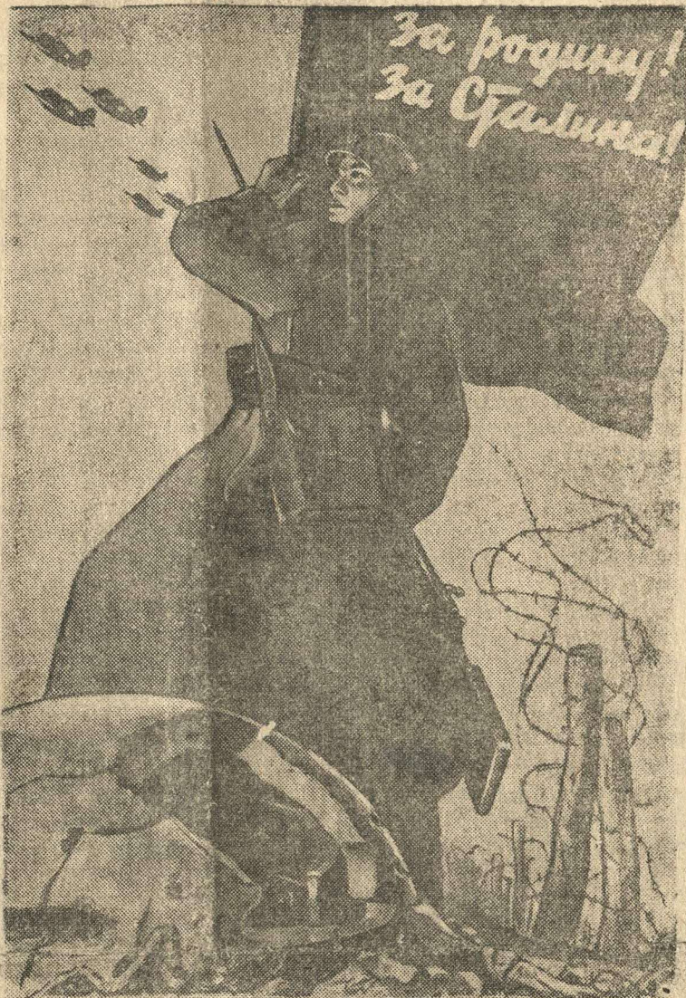
ЛАВА ГЕРОИЧЕСКОЙ КРАСНОЙ АРМИИ

Врагам СССР и впредь должно быть непозвонно совать свое свиное рыло в советский огород! А если кто и осмелится нарушить наш мирный труд, посягнуть на наши границы, то они получат сокрушительный удар Красной Армии, которая помнит слова Ленина: «... Отучить их так, чтобы они детям, внукам и правнукам своим заказали этой штуки не делать».