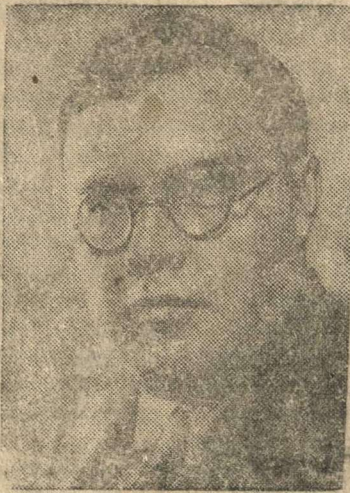
Кандидат в члены Политбюро ЦК ВКП(б) А. С. Щербаков.