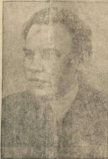
Кандидат в члены Политбюро ЦК ВКП(б) Н. А. Вознесенский.