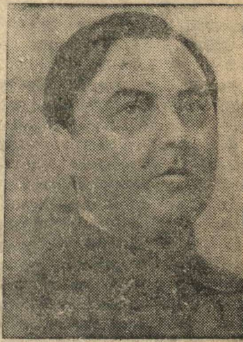
Кандидат в члены Политбюро ЦК ВКП(б) Г. М. Маленков.

К 20 марта — выполнить план лесозаготовок I квартала