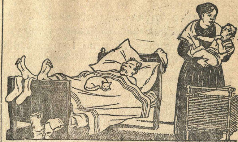
В семье лодыря.

Положение с продовольствием становится в городе все более напряженным. Наиболее острый недостаток испытывается в масле, сахаре и чае.