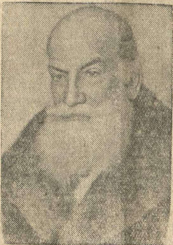
Н. Е. Жуковский

17 марта исполняется 20 лет со дня смерти ученого с мировым именем «отца русской авиации» Н. Е. Жуковского—основателя Военно Воздушной Академии в Москве.