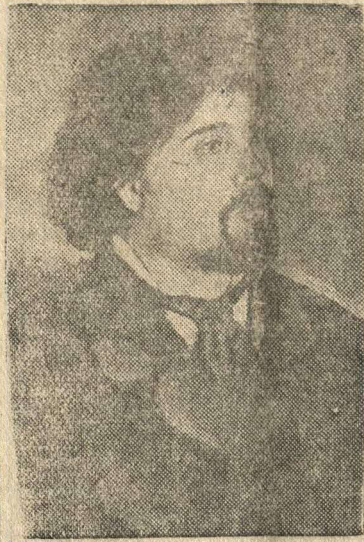
В. И. Суриков (с портрета художника И. Е. Репина, 1887 г.).

В 25-летию со дня смерти (19 марта 1916 г.) знаменитого русского художника В. И. Сурикова