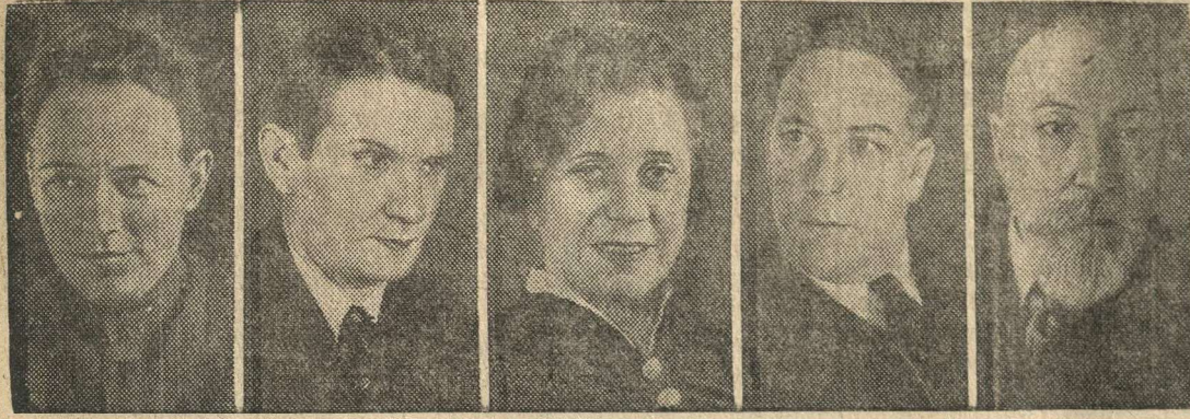
Слева направо: писатель Шолохов Михаил Александрович, действительный член Академии Наук СССР. Лысенко Трофим Денисович, действительный член Академии Наук СССР, президент Всесоюзной Академии Сельскохозяйственных Наук имени Ленина. Барсова Валерия Владимировна, народная артистка СССР, артистка Государственного Ордена Ленина Академического Большого театра СССР. Капица Петр Леонидович, действительный член Академии Наук СССР. Филатов Владимир Петрович, действительный член Академии Наук СССР, директор Украинского института экспериментальной офтальмологии.

Выдающиеся деятели науки, литературы и искусства СССР, получившие Сталинские премии первой степени.