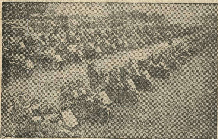
Соединение мотоциклистов в Англии охраняет побережье.

Вр.и.о. ответственного редактора И. П. МАТЮШИН.