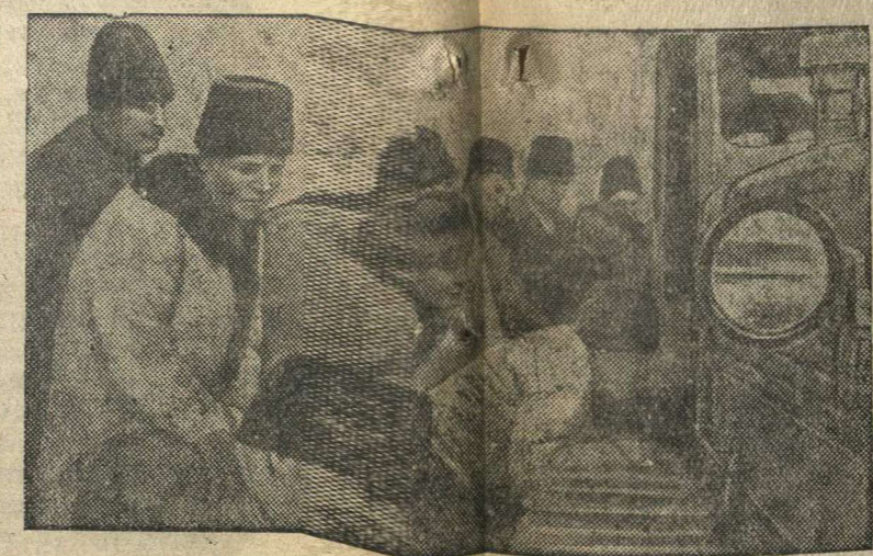
Колхозники недавно организованного колхоза „Новая жизнь“ (село Кыцкавы, Венгский район) осматривают первый трактор, прибывший для обслуживания колхоза в весенне-посевной кампании.

жизнь это важное решение партии и правительства. Год тому назад наша ферма была почти убыточной для колхоза, потому что животноводческие кадры работали на ферме кое-как, придерживаясь такого принципа: „провел день на ферме—получил трудодень и все в порядке“. Но теперь этого настроения нет ни у одного нашего работника. Все работают честно, добиваясь одной цели—получить больше продуктов от скота. Большую роль в деле получения высокой продуктивности и упитанности скота играет режим дня на молочно-товарных и др. фермах. У нас режим установлен и он выполняется. В этот режим входит чистка скота, время раздачи кормов, поение, доение, прогулки и т. п. Выполняя этот режим можно надеяться, что скот во много раз будет и продуктивней и лучше по упитанности. И. ВОЙНОВ, зам. МТФ.