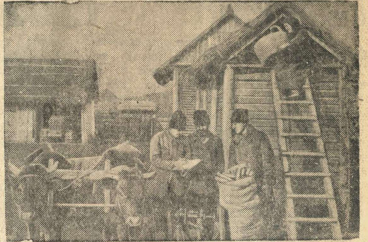
Колхозники колхоза им. Котовского привезли посевной материал.

В Бендерском уезде (Молдавская ССР) в этом году создано два новых колхоза. Колхозники деятельно готовятся в первой большевистской весне.