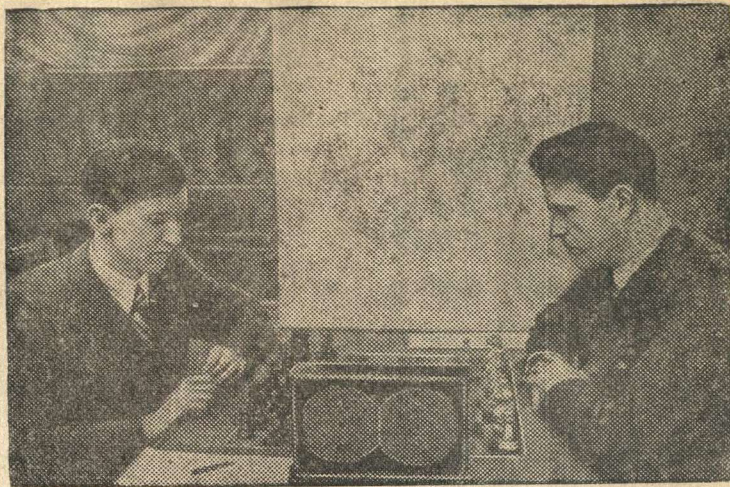
Гроссмейстер А. Лилиенталь (справа) и мастер СССР В. Смыслов разыгрывают партию первого тура.

В Ленинграде во Дворце имени Урицкого проходит первый тур матча-турнира на звание абсолютного чемпиона СССР по шахматам.