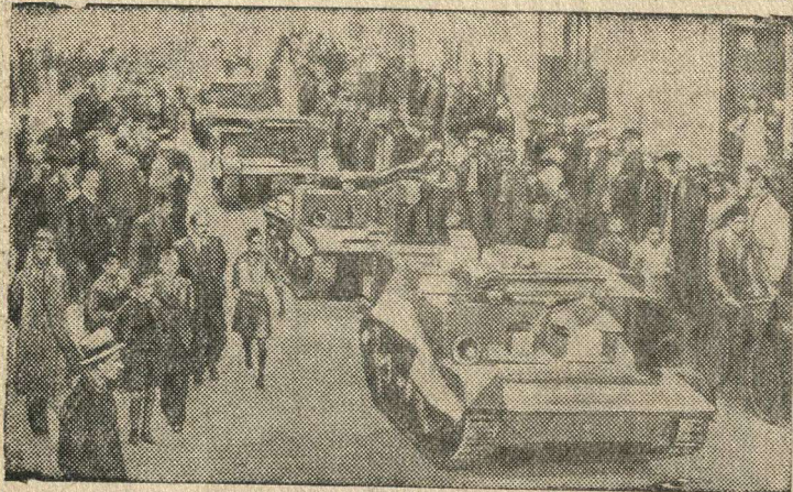
Английские танки в Греции.

Вр. и. о. ответственного редактора И. П. МАТЮШИН.