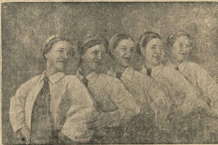
Экцентрический танец в исполнении балетного коллектива.