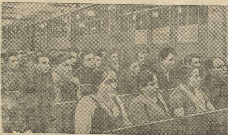
Партсобрание в литейном цехе № 3.

Отчетно-выборное собрание цеховых партийных организаций на заводе имени Сталина (Москва).