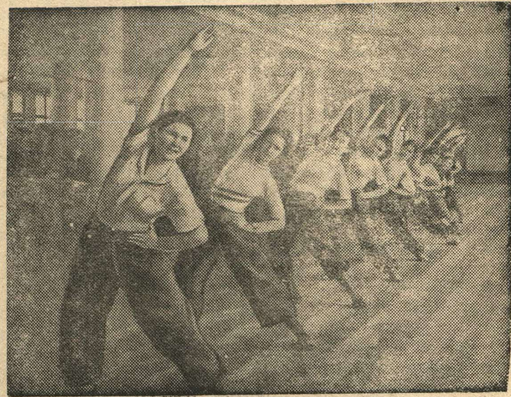
Всесоюзные соревнования по гимнастике.

Группа девушек-комсомолок аэрозавода имени Сталина (Москва) выполняет гимнастические упражнения из комплекса ГТО.