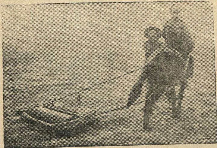
Манчжурский крестьянин на весенних полевых работах.