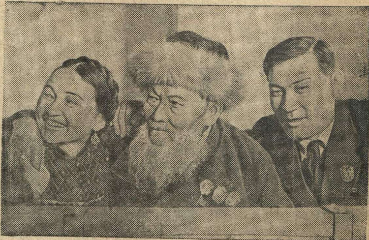
Лауреат Сталинской премии, трижды орденносец Джамбул Джабаев (в центре), народная артистка СССР орденносец Куляш Байсеитов и поэт орденносец Т. Жароков.

столицы новых союзных республик. Будут передаваться записанные на пленку выступления известных всей стране буржиги Алексея Семиволова и машиниста Николая Лунина, выступят выдающиеся деятели искусства — лауреаты Сталинских премий. В течение дня состоится несколько праздничных концертов.