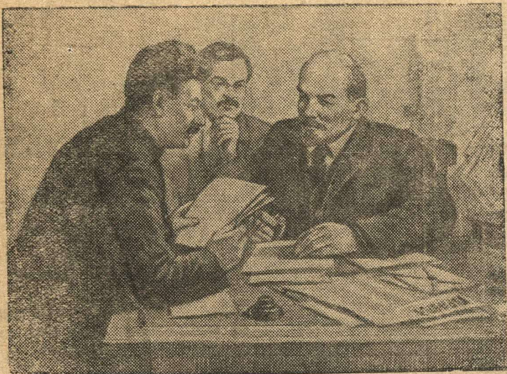
В. И. Ленин, И. В. Сталин и В. М. Молотов в редакции газеты «Правда»—1917 г.

Репродукция из альбома издательства «Искусство» — «Ленин и Сталин».