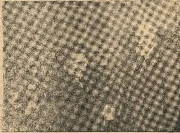
Председатель Комитета по Сталинским премиям в области литературы и искусства В. И. Немирович-Данченко поздравляет писателя С. В. Сергеева-Ценского.

21 и 22 апреля в Москве состоялось вручение дипломов и денежных премий лауреатам Сталинской премии — деятелям науки, изобретательства, искусства и литературы.