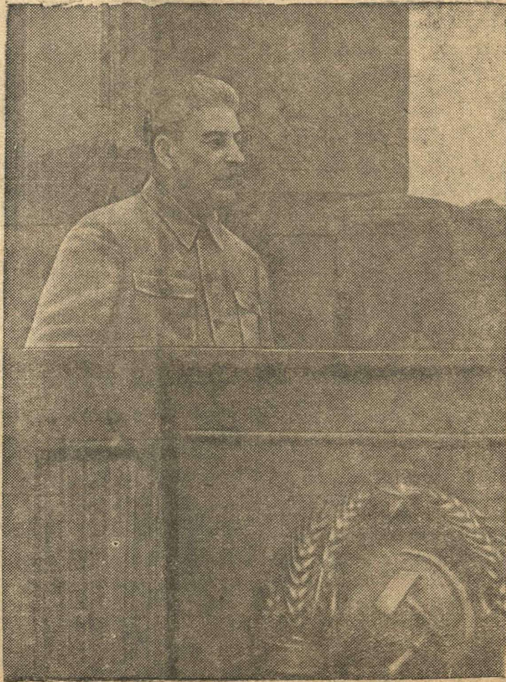
Выступление товарища И. В. Сталина на торжественном собрании, посвященном выпуску командиров, окончивших военные академии, состоявшемся в Большом Кремлевском дворце 5-го мая 1941 года.

Одновременно с медалью награжденным вручается денежная премия в сумме 500 рублей.