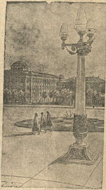
На Театральной площади в г. Ереване (Армянская ССР).