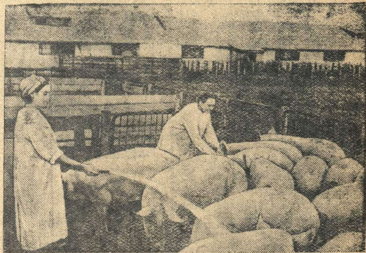
Купанье свиней на лучшей свиноферме № 5 совхоза. На первом плане одна из лучших свинок—стахановка фермы О. Д. Лукьяненко.

Свиноводческий совхоз «Воронцово» (Ленинский район, Московская область) один из крупнейших свиноводческих совхозов Наркомата мясной и молочной промышленности СССР. План первого квартала по сдаче мяса выполнен совхозом на 101 проц., себестоимость центнера привеса значительно снижена.