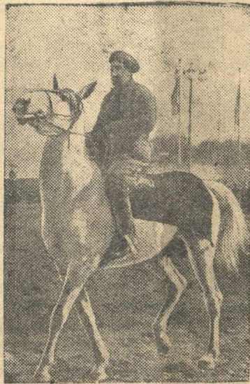
Показ лошадей на выводном круте животноводческого городка ВСХВ.

Всесоюзная сельскохозяйственная выставка 1941 года.