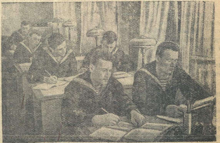
В парткабинете Пинской флотилии (БССР) краснофлотцы комсомольцы за изучением «Краткого курса истории ВКП(б)».