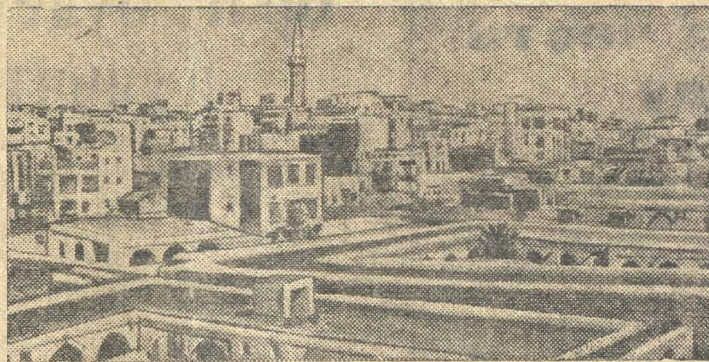
Вид на Каир (Египет).

Министерство просвещения вынуждено было издать специальное распоряжение о запрещении самовольного ухода учителей из школы. Десятки и сотни тысяч школьников вынуждены были прекратить учебу.