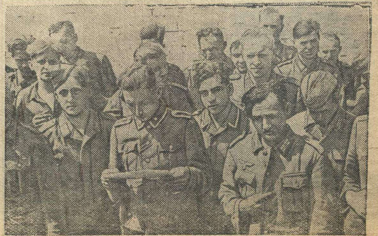
Группа пленных немцев.