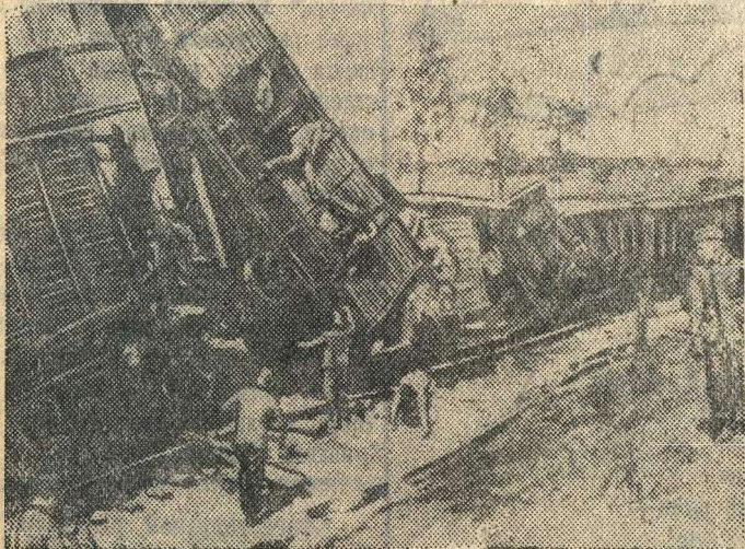
На снимке: крушение немецкого воинского эшелона, организованное одним из отрядов партизан. (Снимок найден у убитого немецкого офицера).

Нашим партизанам и партизанкам — слава! (Бурные, продолжительные аплодисменты. Все встают, овация всего зала).