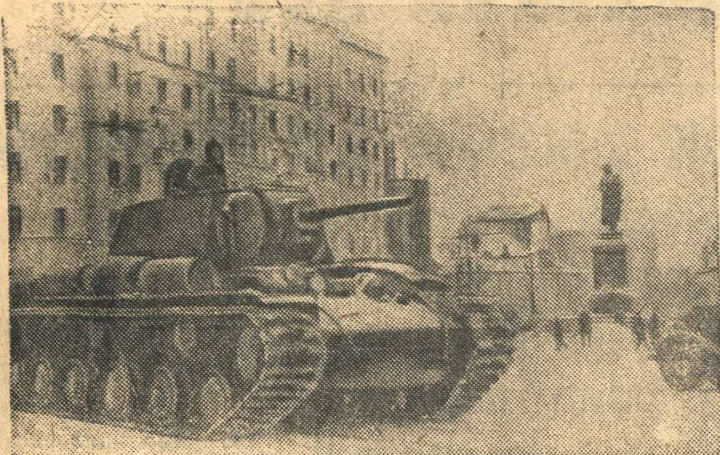
НА СНИМКАХ: 1. Москва в дни немецко-фашистского наступления: Тяжелые танки проходят по площади Пушкина, направляясь на фронт. 2. Бойцы всевобуча гор. Тулы проходят практические занятия на территории, где в прошлом году бы-