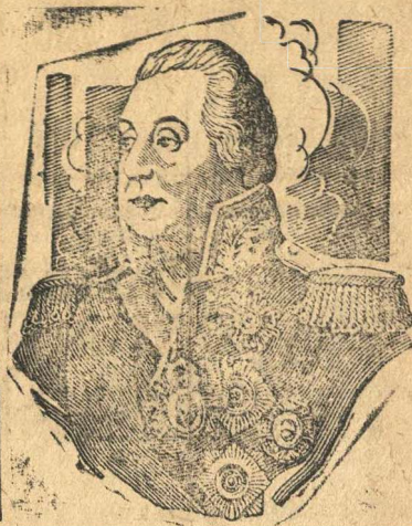
Великий русский полководец М. И. КУТУЗОВ.

В 1774 году, будучи в чине полковника, Кутузов получил ранение, которое врачи считали смертельным. Пуля попала в левый висок и вышла у правого глаза. Но раненый выжил. Во второй Турецкой войне (1787—1791 г.г.) при осаде Очакова генерал-майор Кутузов получил новое страшное ранение: пуля попала в щеку и вышла в затылок. Но смерть и на этот раз поща-