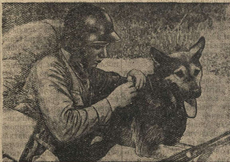
Кадр из фильма. Собака доставила донесение