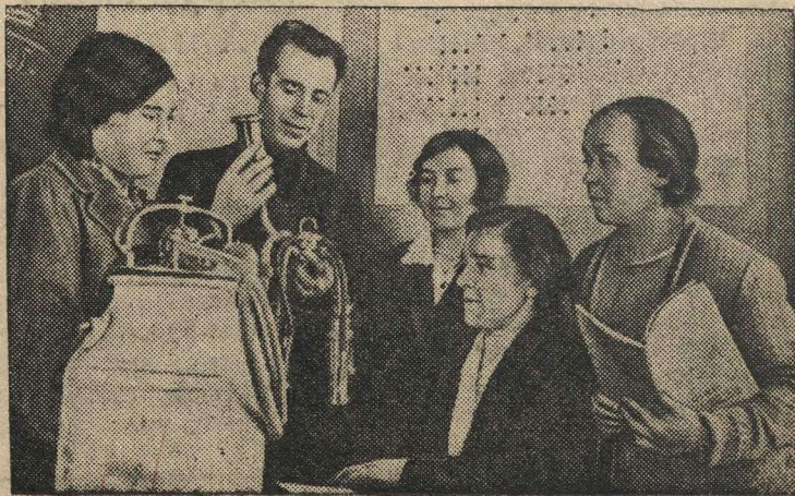
Доярки совхоза изучают приборы механической дойки коров.

Совхоз „Непечино“ (Коломенский район, Московская область) в 1940 году получил в среднем на фуражную корову по 4500 литров молока. За отличную работу ему вручено переходящее Красное знамя Наркомсовхозов РСФСР и ЦИ союза совхозов. Совхоз выдвигает кандидатом на ВСХВ 1941 года.