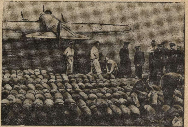
Итальянская авиационная база в Албании.