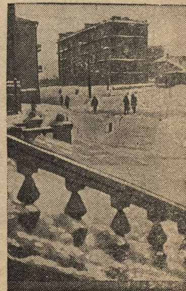
Зима в г. Магадане (Хабаровский край).