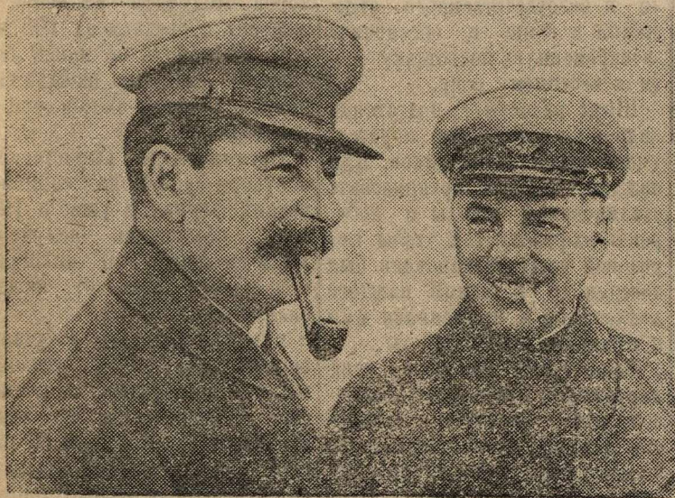
И. В. Сталин и К. Е. Ворошилов (1935 г.).