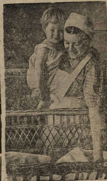
В новых детских яслях № 1 в г. Каунасе.

С установлением Советской власти в Литве введено социальное страхование, бесплатная медицинская помощь. Открываются десятки новых детских яслей, детских поликлиник, амбулаторий, родильных домов и т. д.