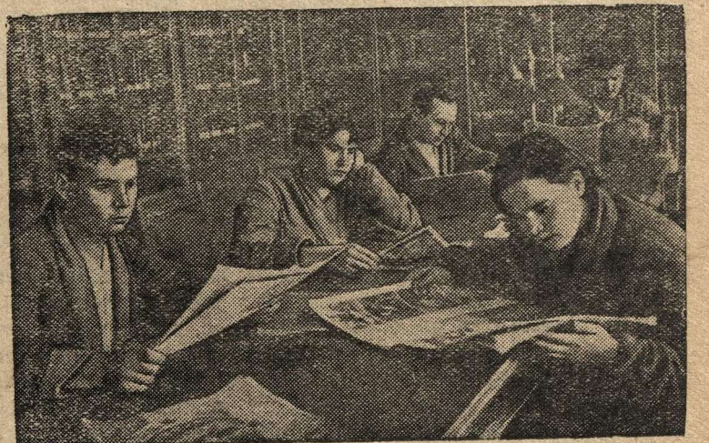
В читальне Украинского института экспериментальной офтальмологии (Одесса). Сюда приходят читать книги, журналы и газеты бывшие слепые, которым академик профессор В. П. Филатов возвратил зрение.

В период работы XVIII Всесоюзной партконференции жители Приморского и Хабаровского краев будут получать московские газеты на несколько дней раньше, чем обычно.