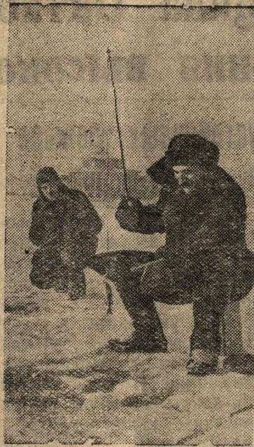
В выходной день на реке Волге у гор. Калинин.

Может быть, пишет газета, подобный план покажется фантастичным, но, по мнению экспертов, к нему необходимо относиться со всей серьезностью. Необходимо учитывать превосходные организаторские способности немцев.