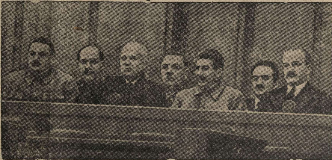
Руководители партии и правительства на совместном заседании Совета Союза и Совета Национальностей. Справа налево: товарищи В. М. Молотов, А. И. Микоян, И. В. Сталин, К. Е. Ворошилов, Н. С. Хрущев, Л. М. Каганович и А. А. Жданов.

25 февраля в Кремле открылась VIII Сессия Верховного Совета СССР.