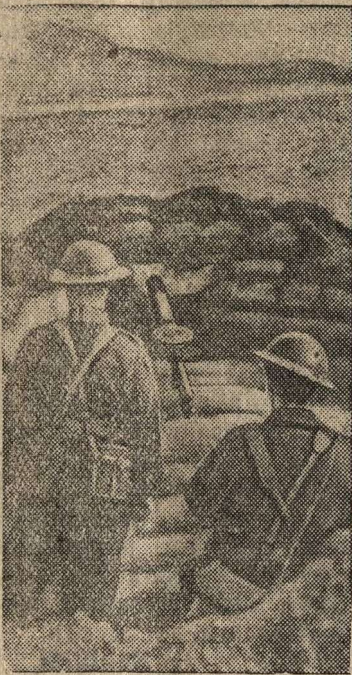
Пулеметное гнездо на одной из дорог в Англии.