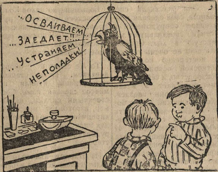
В семье болтуна.

(Из доклада тов. Маленкова на XVIII конференции ВКП(б).)