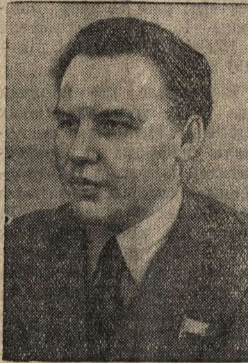
Кандидат в члены Политбюро ЦК ВКП(б) Н. А. Вознесенский.