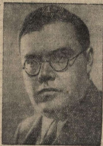
Кандидат в члены Политбюро ЦК ВКП(б) А. С. Щербаков.