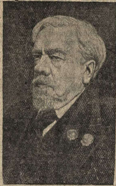
Герой Социалистического Труда академик Сергей Алексеевич Чаплыгин.