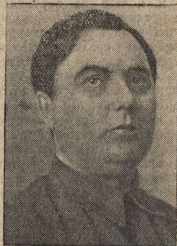
Кандидат в члены Политбюро ЦК ВКП(б) Г. М. Маленков.