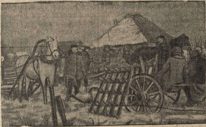
Приемка обобществленного сельхозинвентаря и лошадей правлением колхоза.

В деревне Слобода (Столбцовский район, Барановичская область, БССР) организован новый колхоз „Перемога“. Колхозники приступили к обобществлению инвентаря, лошадей, кормов и семян, готовятся к весеннему севу.