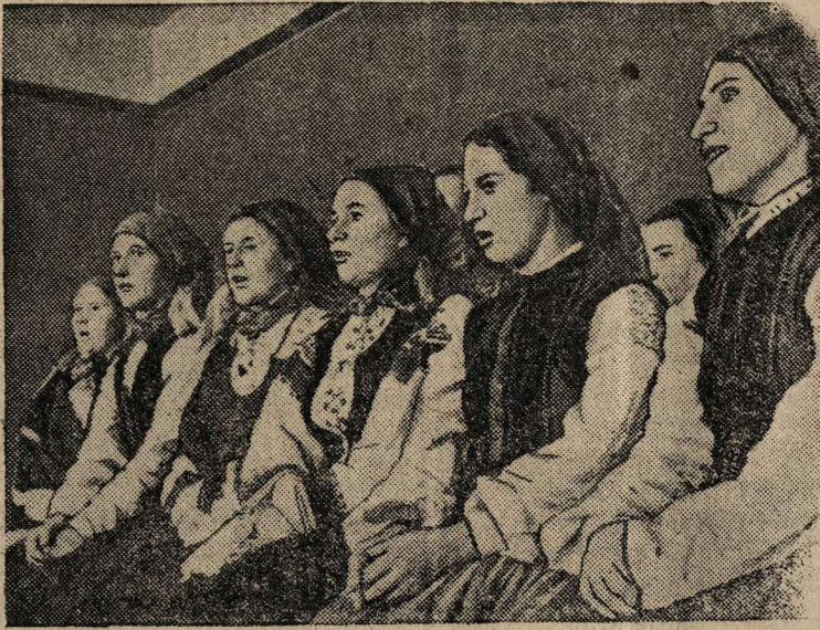
Хоры Ницы и Барты (окрестности Лепая) исполняют народные песни.

Подготовка к декаде латвийского искусства в Москве