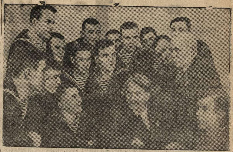
Писатели-орденоносцы С. С. Сергеев-Ценский и А. С. Новиков-Прибой среди курсантов Высшего военного морского ордена Ленина Краснознаменного училища имени М. В. Фрунзе (Ленинград).