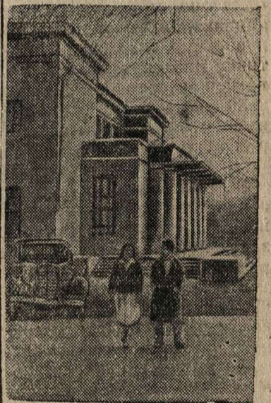
Здание Таджикского Государственного театра имени Лахути в гор. Сталинабаде.

К декаде таджикского искусства в Москве.